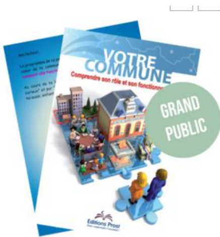
Votre commune – Comprendre son rôle et son fonctionnement

Monsieur le Maire expose le petit livre connu par les éditions Prost qui explique en détail le fonctionnement et le rôle d'une commune.